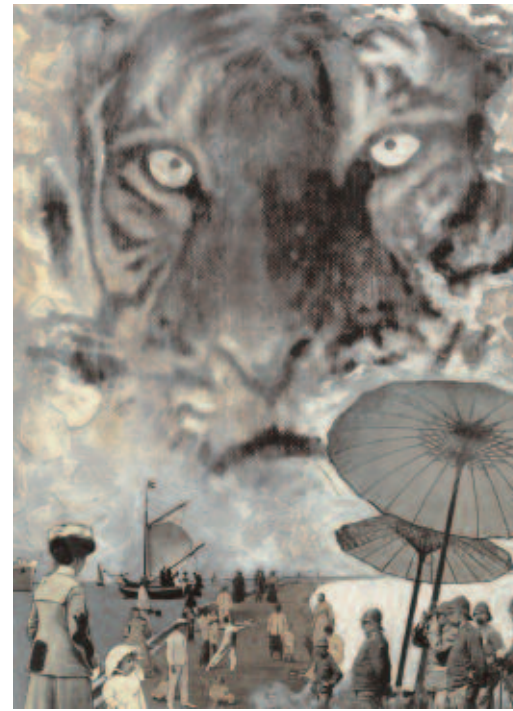
Als de middag voelt naar warme as