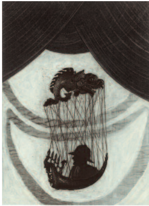
Maan boven Surabaya